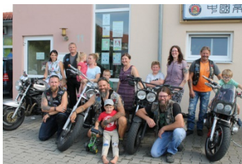
Hawks of Highway, Penzing

Gefreut haben wir uns vor allem über die vielen großen und kleinen Spenden.