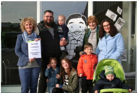
Spendenübergabe Flohquadrat Landsberg

Neben großen Spenden haben wir uns vor allem die vielen kleinen Spenden aus den Reihen der Besucher gefreut.